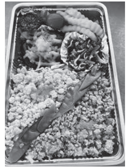
魚国さんの豪華なお花見弁当