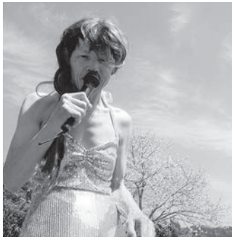
アイドル登場 キャー!!