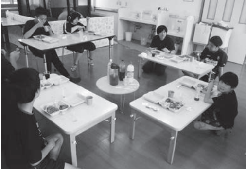
皆で作ったお弁当は最高！

て競い合うなど、景品を賭けた真剣勝負が繰り広げられました。食後の運動として暑い日でしたが、散歩を頑張る事でデザートのアイスクリームがより美味しく感じられました。