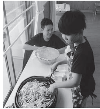
ぼくはコックさん

5月28日(土)、児童デイサービス事業所「ひかり」にて、お楽しみ会を行いました。昨年度はお弁当を食べきれない方が多かったので、今回は皆で調理実習をして焼きそばやフライドポテトを作ったり、新宮市のケンタッキーまでチ