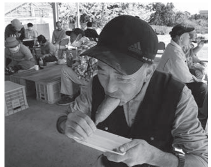
「アメリカンドッグおいしいのお〜!!」