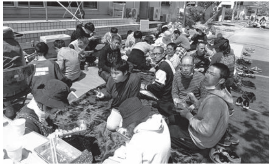
おいすぎてペロリ