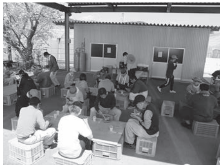
お花見弁当 外で食べると最高!!