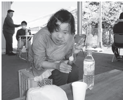
「やっぱり花より団子よ♡」