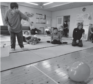
それ当たって出て！