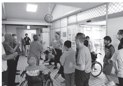
早く割って! 中から何かが...