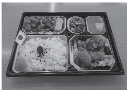
おいしそうな豪華弁当