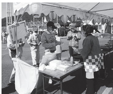
おいしそう!! 「フランクフルトくださいー」