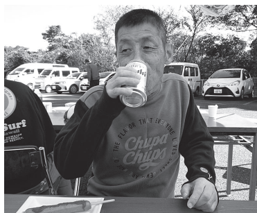
ゴクゴク「あ〜うまい！」

10月26日(水)、抜けるような青空のもと、紀南ひかり園太平洋広場にて秋まつりが開催されました。ゲームコーナーでは、ストラックアウトと射的を楽しみ、景品をもらって喜んでいました。また、熊野プロパンさんにボランティアで参加頂き、ご寄付して頂いたガス風船は大盛況で、風船片手に更に喜んでいました。模擬店は魚国さんに準備販売していただいたフランクフルト、唐揚げ、ジュース、焼きそば、おにぎりと盛り沢山であり、お腹いっぱいになりました。紀南ひかり園とグリーンプラザで2部に分かれて開催しましたが、それぞれよく遊んでよく食べて楽しいひと時を過ごせた様子でした。