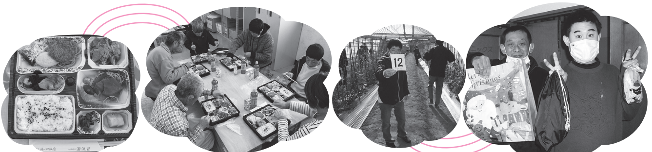
滞流荘の豪華なお弁当おいしいネ!