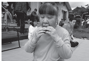
「フーフー あっまっ!」