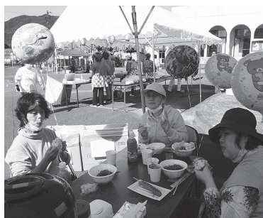
「いっぱい食べたよ♡」 大満足の笑顔です