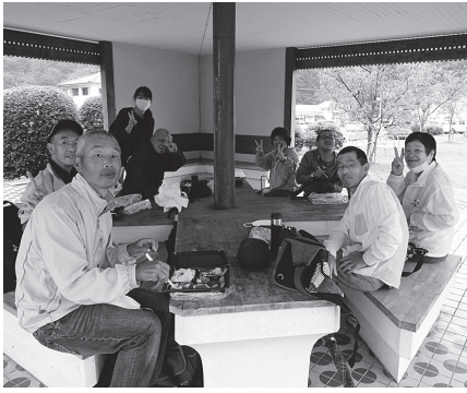
雨でも楽しいよ ピース