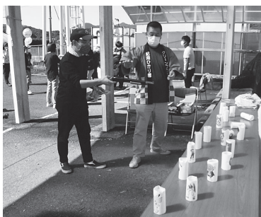
狙いを定めてバーン!!!