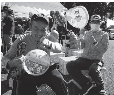
大人気のガス風船