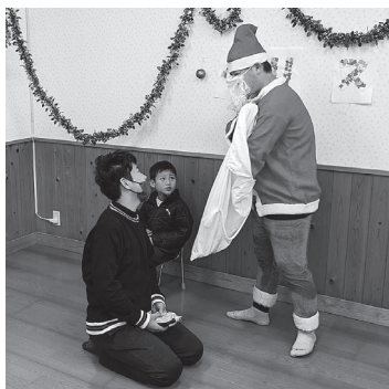
ワクワク・ドキドキ・プレゼント

12月15日(木)、児童デイ「ひかり」にてクリスマス会を開催しました。例年、土曜営業日の昼食を兼ねて開催していましたが、今回は平日開催をしました。来所後は会場の飾り付けをしたり、サンタの衣装に着替