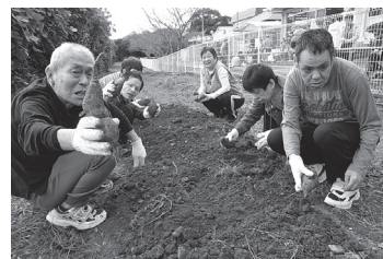
大きいの採れたで!