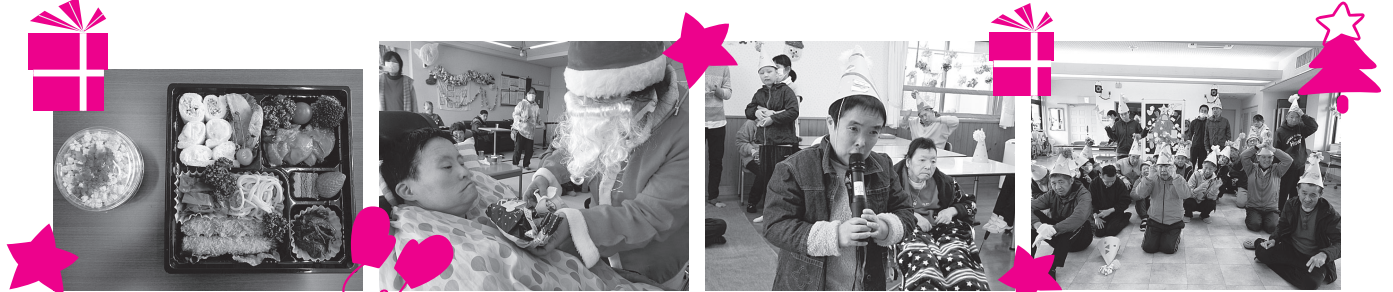
魚国さん手作り豪華なお弁当 今年のプレゼントは何かな～？ 真剣にモニター見つめ歌声披露 完成した壁画のツリーをバックにポーズ!!