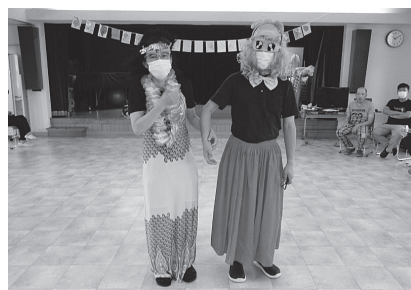
変身 私は誰でしょう?