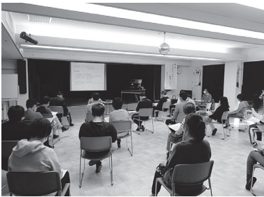
講義を受ける職員