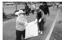
公園周りのゴミ拾い