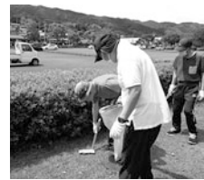
ゴミを見つけたらすぐ撤去！

6月7日(水)自治会活動の一環で利用者3名、職員1名で山崎公園と遊歩道周辺のゴミ拾いを行いました。ペットボトルや空き缶、お菓子の箱など拾い集め、とても綺麗になりました。