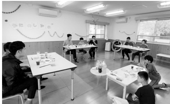
ごちそうがたくさん☆「いただきます」