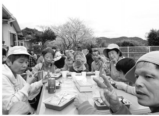
お花見楽しい!!最高ー!!