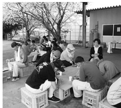
外で食べるお弁当はサイコー!!