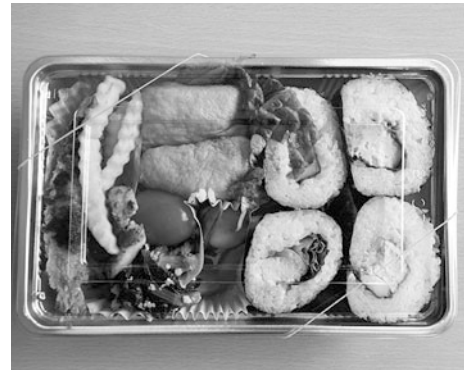
魚国さんの豪華なお花見弁当