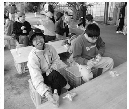
デザートのシュークリーム♡おいしい!!