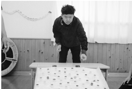
高得点の穴をねらって商品ゲット!!!