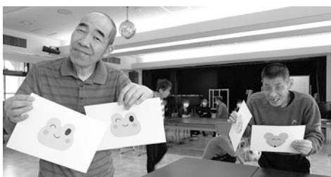
「やったー！絵がそろったよ！」