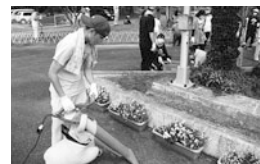
事務所周りもピカピカ

自治会が主体となって、4月5日(水)花見の後に山崎公園内、道中の清掃、芝園バス停までの通路のゴミ拾い等の奉仕活動を行いました。 又、5月18日(木)午後から環境美化活動として、事業所周りの除草や溝掃除を利用者・職員全員で行い大変綺麗になりました。